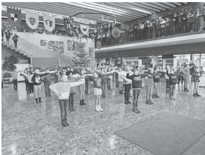
Die 3. und 4. Klassen eröffneten mit ihrem Tanz stimmungsvoll die Schülervollversammlung.