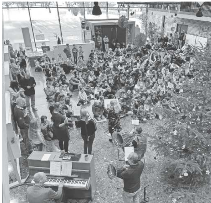
Die Schülerinnen und Schüler der Grund- und GMS Obere Donau versammelten sich im Foyer.

Vanessa Lingner/Kathrin Griebler/Andrea Spengler – Querflöte.